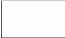
C10 RAL 9016/5807A90160S70 Verkehrsweiss

Eine Auswahl von 14 IGP-DURA®face Produktserie 58, Qualicoat Klasse 1.