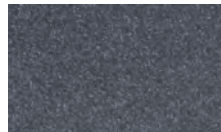
C34 ~DB703/5803E71386A10 Ferrite