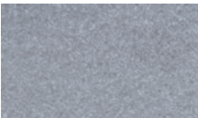
C28 RAL 9006/5807E90060S10 Weissaluminium