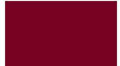
C24 RAL 3004/5807A30040S70 Purpurrot